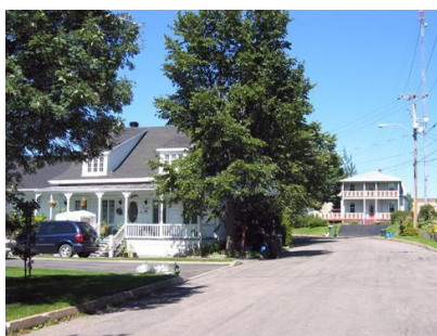
Maisons de la Côte des Érables

Plusieurs maisons s'y sont rajoutés au cours des siècles jusqu'aux années 1960. On y dénombre maintenant plus de 25 maison.