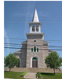
Église de Saint-Émile