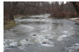
Rivière Lorette

Après ces travaux, la rivière devrait récupérer sa beauté, sa quiétude et son lit!